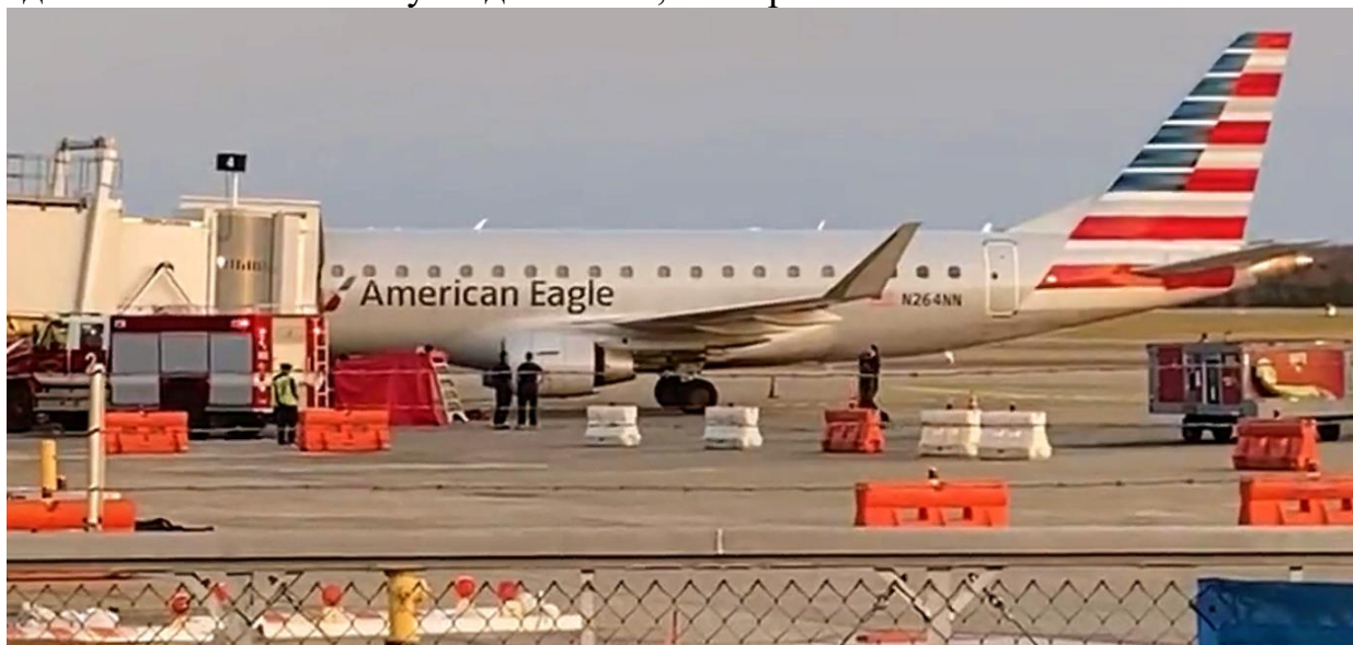
Рис. 1 Место чрезвычайного происшествия в аэропорту Монтгомери

Отчет показал, что после прибытия ВС, погибший агент направлялся в сторону работающего двигателя с конусом безопасности. Несмотря на устные предупреждения коллег о работающем двигателе агент продолжил движение и был затянут в двигатель, что привело к гибели.